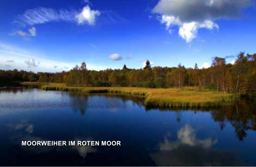
MOORWEIHER IM ROTEN MOOR

Auf den Hochebenen befinden sich die beiden größten Hochmoore der Rhön – DAS SCHWARZE und DAS ROTE MOOR . Das Schwarze Moor liegt am Dreiländereck Hessen, Thüringen und Bayern; das Rote Moor zwischen Wüstensachsen und Bischofsheim. Um die relativ große Anzahl von Besuchern in Einklang mit dem Naturschutz zu bringen, wurden beide Moore mit einem Kinderwagen- und Rollstuhl-gerechten Bohlenpfad als sogenannter Moorlehrpfad mit vielen interessanten Informationen zu Flora und Fauna touristisch erschlossen. Beide Aussichtstürme bieten zudem einen sehr schönen Blick über die Moorflächen und selbst bei Nebel und etwas regnerischem Wetter kommen die Besucher gerne hierher, um diese ganz besondere Atmosphäre zu erleben.