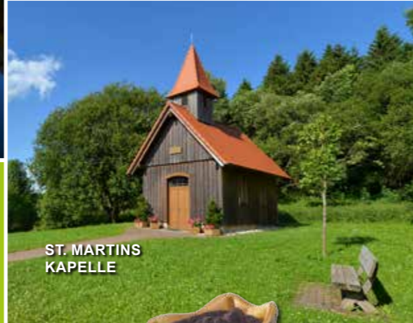
ST. MARTINS KAPELLE

Ein weiteres Kleinod der Rhön ist die kleine ST. MARTINSKAPELLE , die zum Ehrenberger Ortsteil Reulbach gehört. Auf diesem Fleckchen Erde kann man wunderbar zur Ruhe kommen. Zudem hat man auch von hier oben eine fantastische Aussicht weit ins Tal hinein.